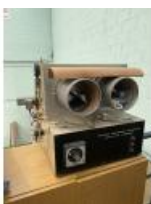
Referencia: TTR-014 TEST PILLING Año: . Marca: ATLAS Ancho mesa: .