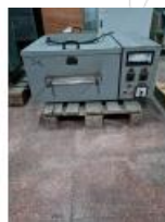
Referencia: M-1712 RAMETA DE LABORATORIO Año: . Marca: Werner Mathis AG Ancho mesa: .