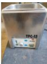
Referencia: M-1590 LIMPIADOR POR ULTRASONIDOS Año: . Marca: TELSONIC Ancho mesa: .